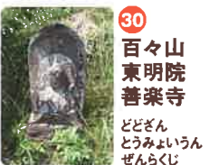
30 百々山 東明院 善楽寺 どっどざん とうみやういん ぜんらくじ