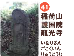
41 稻荷山 護国院 龍光寺 いなりざん ごこくいん りゆうこうじ