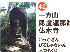
42 一方山 毘盧遮那院 仏木寺 いつかざん びろくしゃなんいん ぶつこくじ