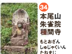
34 本尾山 朱雀院 種間寺 もとざん しゆじゆいん ねむらじ