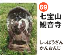
69 七宝山 観音寺 しっぽうざん かのんじ