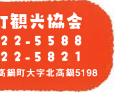
88 医王山 遍照院 大窪寺 いおうざん へんじやういん おおくぼじ