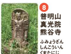
8 普明山 真光院 熊谷寺 ふみんざん しんくわいん くまにじ