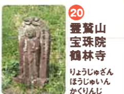
20 靈鷲山 宝珠院 鶴林寺 りやうじゆざん ほうじゆいん かくりんじ