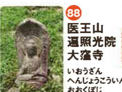
86 補陀落山 志度寺 ふだらくざん しどじ