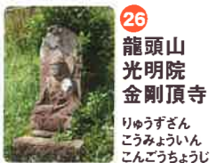
26 龍頭山 光明院 金剛頂寺 りゆうずざん こうみんいん こんごうちやうじ