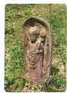
13 大栗山 花蔵院 大日寺 おぐりざん けさういん だいにちじ