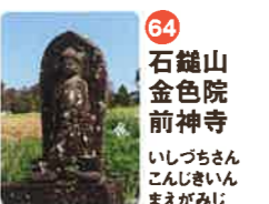
64 石鏡山 金色院 前神寺 いしづちざん こんじきいん まえがみじ