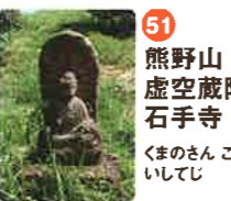
51 熊野山 虚空蔵院 石手寺 くまのざん こくうざういん いしてじ