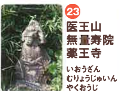
23 医王山 無量寿院 薬王寺 いおうざん むりやうじゆいん やくおうじ