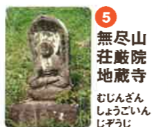
5 無尽山 莊嚴院 地藏寺 むじんざん じやうげんいん じぞうじ