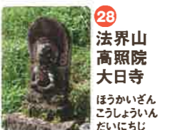
28 法界山 高照院 大日寺 ほうかいざん こうじやういん だいにちじ