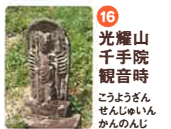
16 光耀山 千手院 観音寺 こうようざん せんじゆいん かのんじ