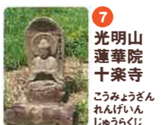
7 光明山 蓮華院 十楽寺 こうみんざん れんげいん じゅうらくじ