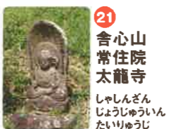
21 舎心山 常住院 太龍寺 しゃしんざん じやうじゆいん たいりゆうじ