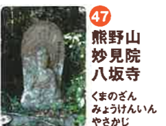
47 熊野山 妙見院 八坂寺 くまのざん せうけんいん やさかじ