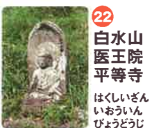
22 白水山 医王院 平等寺 はくしざん いおういん びやうどうじ