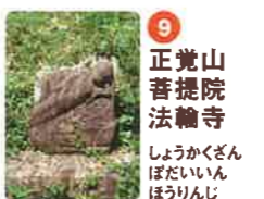
9 正覚山 菩提院 法輪寺 しやうかくざん ぼだいいん ほうりんじ