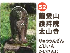
52 龍雲山 護持院 太山寺 りゆううんざん たいざんじ