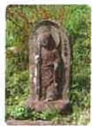
25 宝珠山 真言院 津照寺 ほうじゆざん しんごんいん しんじやうじ