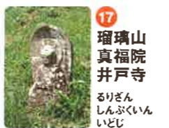
17 瑠璃山 真福院 井戸寺 るりざん しんぷくいん いどじ