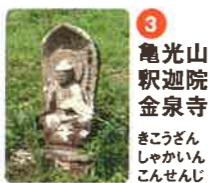
3 亀光山 釈迦院 金泉寺 かみこうざん しゃかいいん こんせんじ