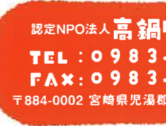
87 補陀落山 観音院 親尾寺 ふだらくざん かのんいん ねおじ