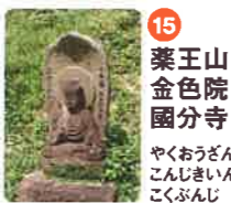
15 薬王山 金色院 園分寺 やくおうざん こんじきいん こんぶんじ