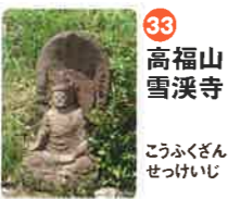
33 高福山 雪渓寺 こうふくざん せつけいじ