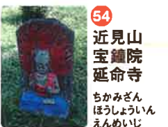
54 近見山 宝鏡院 延命寺 ちかみざん ほうきやういん えんめいじ