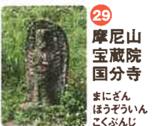
29 摩尼山 宝蔵院 宝蔵寺 まにざん ほうざういん ほうざうじ