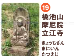
19 橋池山 摩尼院 立江寺 きやうちざん まにいん たつえじ