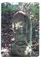
43 源光山 円手院 明石寺 げんこうざん えんじゆいん めいせきじ