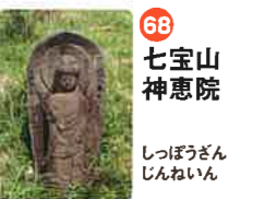
68 七宝山 神恵院 しっぽうざん しんねいん