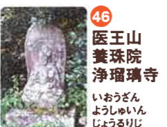
46 医王山 養珠院 浄瑠璃寺 いおうざん じやうじゆいん じやうりりじ