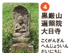
4 黒巖山 遍照院 大日寺 くろいざん へんじやういん だいにちじ