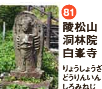
81 陵松山 洞林院 白峯寺 りやうしようざん どうりんいん しらみねじ