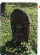
55 別宮山 金剛院 南光坊 べつぐざん こんごういん なんこうぼう