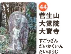
44 菅生山 大覚院 大寶寺 すこうざん だいかくいん だいほうじ