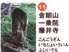
11 金剛山 一乘院 藤井寺 こんごうざん いちじょういん ふじいでら