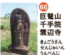
66 巨鷲山 千手院 雲辺寺 きよじゆざん せんじゆいん うんぺんじ