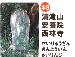
48 清滝山 養賢院 西林寺 せいらくざん じやうけんいん せいりんじ