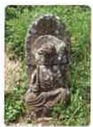
31 五台山 金色院 竹林寺 ごだいざん こんじきいん ちくりんじ