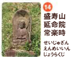
14 盛寿山 延命院 常楽寺 せいじゆざん えんめいいん じやうらくじ