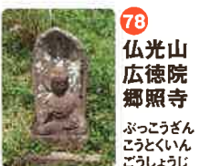
78 仏光山 広徳院 郷照寺 ぶつこうざん こうとくいん 郷じやうじ