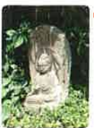
49 西林山 三蔵院 浄土寺 さいりんざん さんざういん じやうどじ