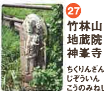
27 竹林山 地藏院 神峯寺 ちくりんざん じぞういん しののねじ