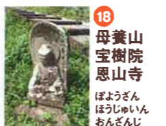
18 母養山 宝樹院 恩山寺 ぼようざん ほうじゆいん おんざんじ