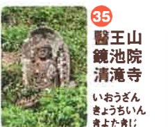
35 醫王山 鏡池院 清滝寺 いおうざん きやうちいん きよたきじ