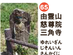
65 由霊山 慈尊院 三角寺 ゆれいざん じゆんいん さんかくじ