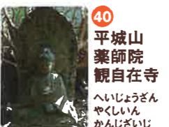
40 平城山 薬師院 観自在寺 へいじやうざん やくしいん かんじざいじ