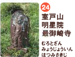
24 室戸山 明星院 最御崎寺 むろとざん むりやうじゆいん ほつみやさきじ