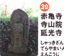
39 赤亀寺 山院 延光寺 しゃつきざん ざんいん えんこうじ