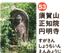
53 須賀山 正知院 円明寺 すがざん せいぢいん えんめいじ