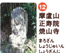
12 摩盧山 正寿院 焼山寺 まろざん せいじゆいん しょうざんじ