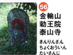
56 金輪山 勅王院 泰山寺 きんりんざん ちくおういん たいざんじ