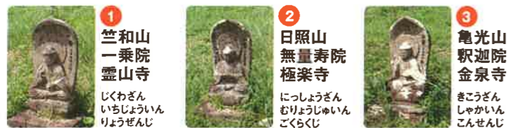
1 竺和山 一乘院 靈山寺 しくわさん いちじょういん りょうぜんじ