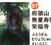
57 府頭山 無量寿院 栄福寺 ふとうざん むりやうじゆいん えいふくじ