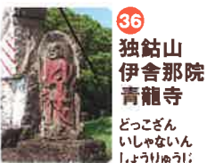
36 独鈷山 伊舍那院 青龍寺 どっこざん いしゃなんいん しょうりゆうじ