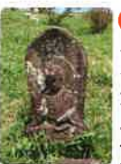
67 小松尾山 不動光院 大興寺 こまつおざん ぶどうこういん だいこうじ