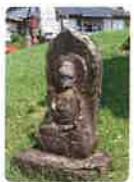
37 藤井山 五智院 岩本寺 ふじいざん ごちいん いわもとじ