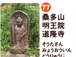
77 桑多山 明王院 道隆寺 そうたざん みやうおういん どうりゆうじ