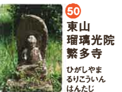
50 東山 瑠璃光院 繁多寺 ひがしやま りくわいん はんたじ