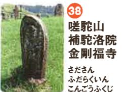
38 嗟駝山 補陀洛院 金剛福寺 さだざん ぶたらくいん こんごうふくじ