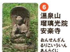
6 温泉山 瑠璃光院 安楽寺 おんせんざん ほうりくわいん あんらくじ