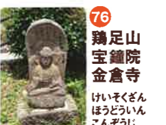
76 鶏足山 宝鏡院 金倉寺 けいそくざん ほうきやういん こんざうじ