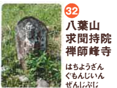
32 八葉山 求聞持院 禅師峰寺 はちようざん ぐもんぢいん ぜんじふじ