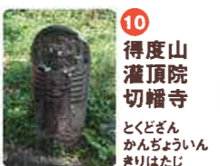
10 得度山 灌頂院 切幡寺 とくどざん かんじやういん きりはたじ