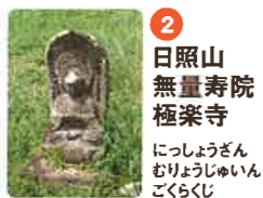
2 日照山 無量寿院 極楽寺 にっしょうざん むりょうじゆいん ごくらくじ