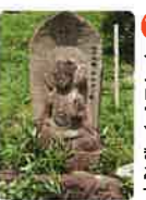
79 金華山 高照院 天皇寺 きんかざん こうじやういん てんのうじ