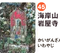
45 海岸山 岩屋寺 かいがざん いわやじ